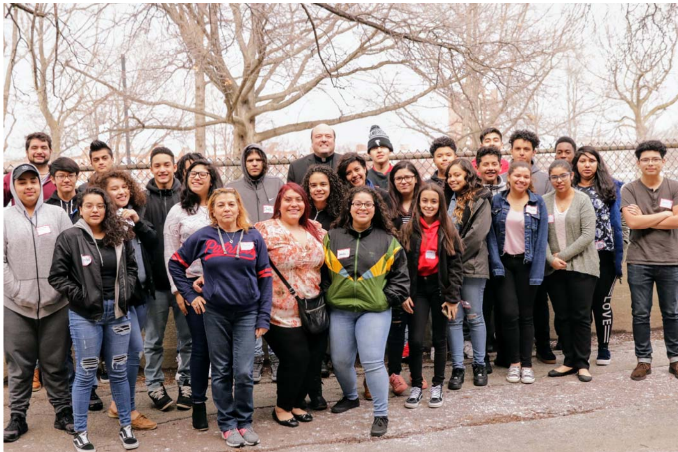
Confirmation Retreat 2018 ~ Retiro de Confirmación 2018