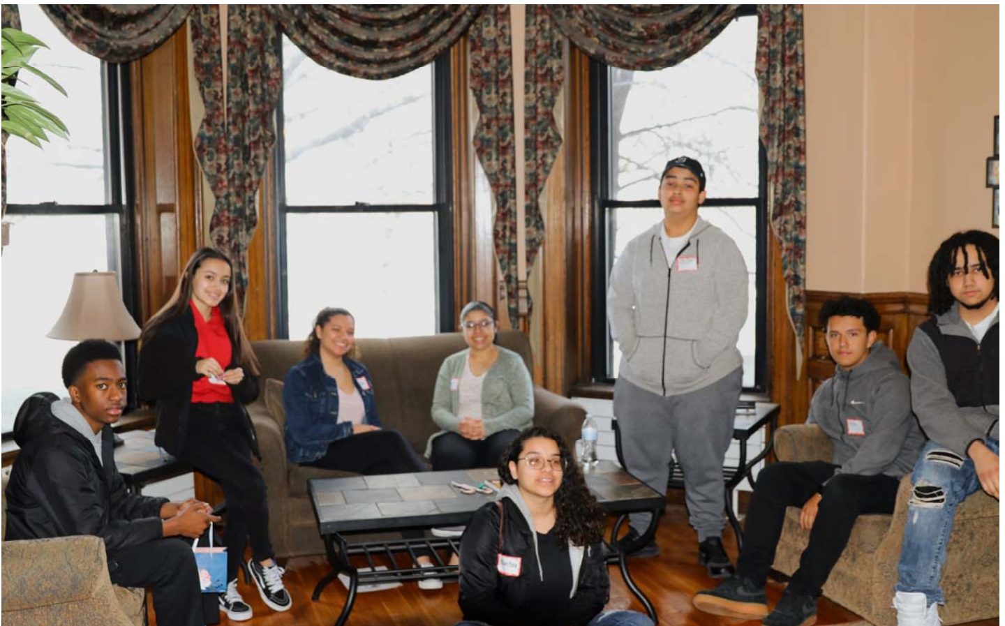
Confirmation Retreat 2018 ~ Retiro de Confirmación

Invito a todas nuestras familias con niños en la escuela a asistir a nuestras reuniones de la Sagrada Familia que tendrán lugar en abril el sábado 21 de abril de 6:00 a 8:00 pm y luego en mayo el sábado 5 de mayo de 6:00 a 8:00 p.m. y el sábado 19 de mayo de 6:00 a 8:00 p.m. Espero ver a todas nuestras familias con niños en edad escolar asistiendo.